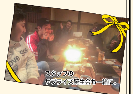
スタッフの サプライズ誕生会も一緒に。